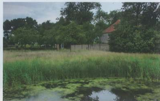
In de uiterste zuidwestelijke hoek, grenzend aan de notenboomgaard, is een tweede zoetwaterput gegraven vooral vanwege de rijke natuur die het water aantrekt.