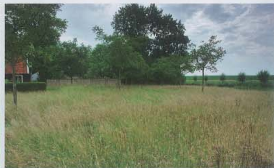
Langs de grens van de notenboomgaard staat een muur die afkomstig is van een oude schuur die is afgebroken. Daarachter ligt de siertuin die Piet Oudolf heeft ontworpen. Rechts langs de nieuw gegraven ringsloot zijn knotwilgen aangeplant als omlijsting van het boerenerf. (Extra foto's van onder meer de door Piet Oudolf ontworpen siertuin vindt u op www.tuinenlandschap.nl )

kippen en schapen kunnen scharrelen. Op een groepje linden na, dat de erfgrens markeert, is dit gedeelte open gelaten. Wolff heeft dit gedaan om zo afstand te scheppen tussen het erf en de natuur.