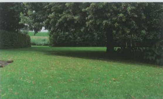
In de bestaande gemengde boomsingel rondom het erf zijn verschillende doorkijkjes gemaakt om zo contact met het omringende natuurgebied te maken.