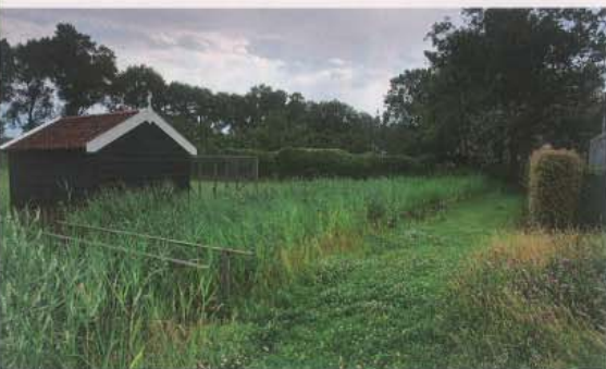
Een bruggetje over de reeds bestaande sloot verbindt de grasweide met de notenboomgaard. De watergang vormt samen met de rij Fraxinus excelsior de vroegere erfgrens. Het riet wordt regelmatig rigoureus weggehaald omdat de sloot anders binnen een jaar verlandt.