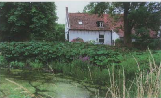
Sinds 1993 wordt de Zeeuwse boerderij bewoont door Haagse stedelingen. Zij hebben de hoeve nagenoeg volledig intact gelaten.