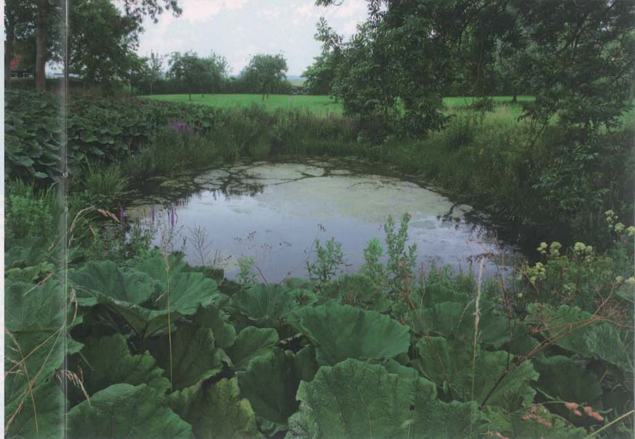
Over de bestaande zoetwatervijver is een zichtlijn gemaakt door de nieuwe boomgaard richting het hek; bij helder weer is de toren van Sint-Maartensdijk te zien. Het stenen 'karrenspoor' van kantkeien – een materiaal dat in Zeeland veel wordt gebruikt - loopt achter het hek door tot aan het einde van het erf.

Tussen de grasweide en de siertuin is een tweede nieuwe boomgaard aangelegd. In deze groeien noten: „die horen bij een boerenerf”, aldus de eigenaar. Omdat dit vroeger landbouwgrond was, zit hier nog veel mest in de grond; het hooiland wordt daarom voortdurend gemaaid om de mest eruit te trekken. Volgens de eigenaar een proces van jaren „maar met als voordeel dat het er in het voorjaar met een weelde aan wilde bloemen ongelofelijk mooi uitziet.” In dit gedeelte is een tweede zoetwaterpoel gegraven vooral vanwege het natuurschoon dat het water aantrekt. Het geheel wordt omzoomd door een graspad met knotwilgen.